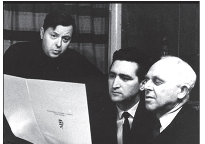
Монумент воинам-освободителям Брянска и партизанам (1958–1966) — это третья совместная работа выдающихся скульптора А. Файдыш-Крандиевского и архитекторов М. Барша и А. Колчина.

— Много пришлось передумать, перепробовать вариантов той группы, что слева — партизанской, пока мы остановились на том, что вы сейчас видите. Главную смысловую нагрузку, по нашему мнению, несет старик-вожак в центре. Он много видел на своем веку, знает цену жизни и уверен в правоте своего патриотического дела. Такой человек пройдет через все трудности, ни перед чем не остановится, только бы изгнать супостатов с родной земли. Поэтому и льнут к нему и